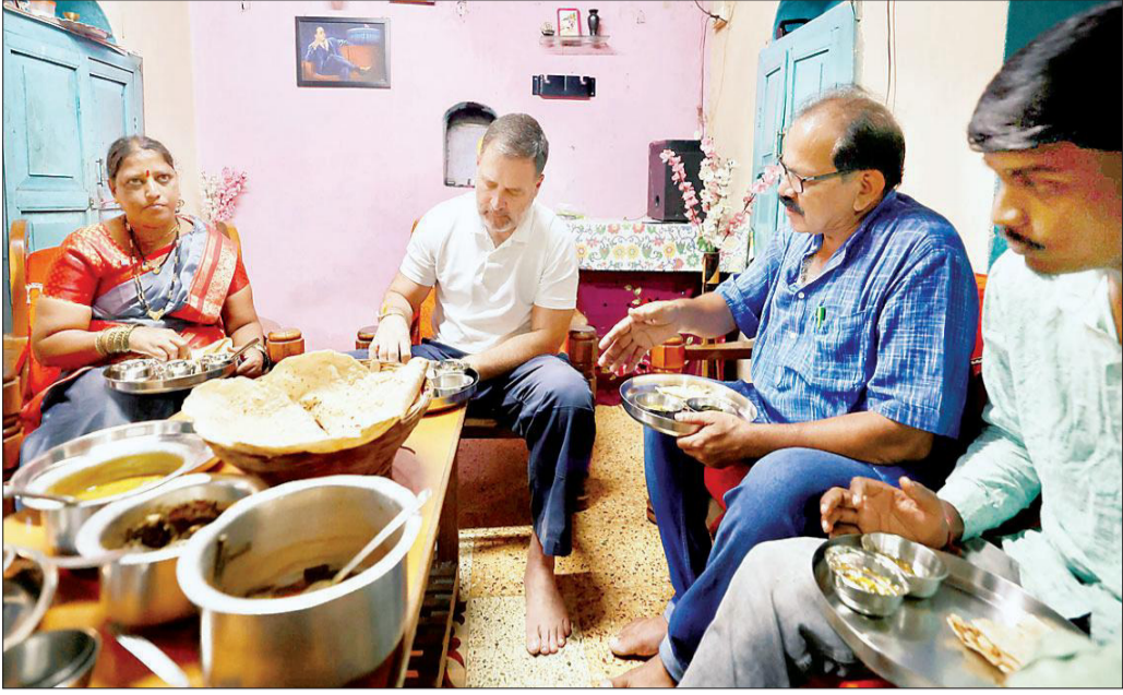
सोमवार को लोकसभा में विपक्ष के नेता राहुल गांधी ने महाराष्ट्र के कोल्हापुर में दलित समुदाय से आने वाले अजय तुकाराम सनाडे और अंजना तुकाराम सनाडे के आवास पर जाकर भोजन किया।