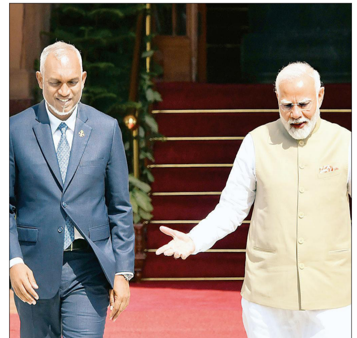
सोमवार को नई दिल्ली के हैदराबाद हाउस में बैठक से पहले प्रधानमंत्री नरेंद्र मोदी और मालदीव के राष्ट्रपति मोहम्मद मुइज्जु।

स्थान है। उन्होंने कहा कि भारत ने सदैव मालदीव के लिए सबसे पहले मददगार की भूमिका निभाई है। चाहे मालदीव के लोगों के लिए आवश्यक वस्तुओं की जरूरत पूरा करना हो, प्राकृतिक आपदा के समय पीने का पानी उपलब्ध कराना हो या कोविड के समय वैकसीन देने की बात हो। भारत ने हमेशा अपने पड़ोसी होने के दायित्व को निभाया है। प्रधानमंत्री मोदी ने कहा कि आज हमने आपसी सहयोग को रणनीतिक दिशा देने के लिए 'समग्र आर्थिक एवं समुद्री सुरक्षा साझेदारी' विज़न अपनाया है। विकास साझेदारी हमारे संबंधों का अहम स्तंभ है। हमने, इसमें हमेशा मालदीव के लोगों की प्राथमिकताओं को प्रमुखता दी है। इस वर्ष भारतीय स्टेट बैंक ने मालदीव के 10 करोड़ डॉलर के 'ट्रेजरी बिल्स' का रोल ओवर किया है।