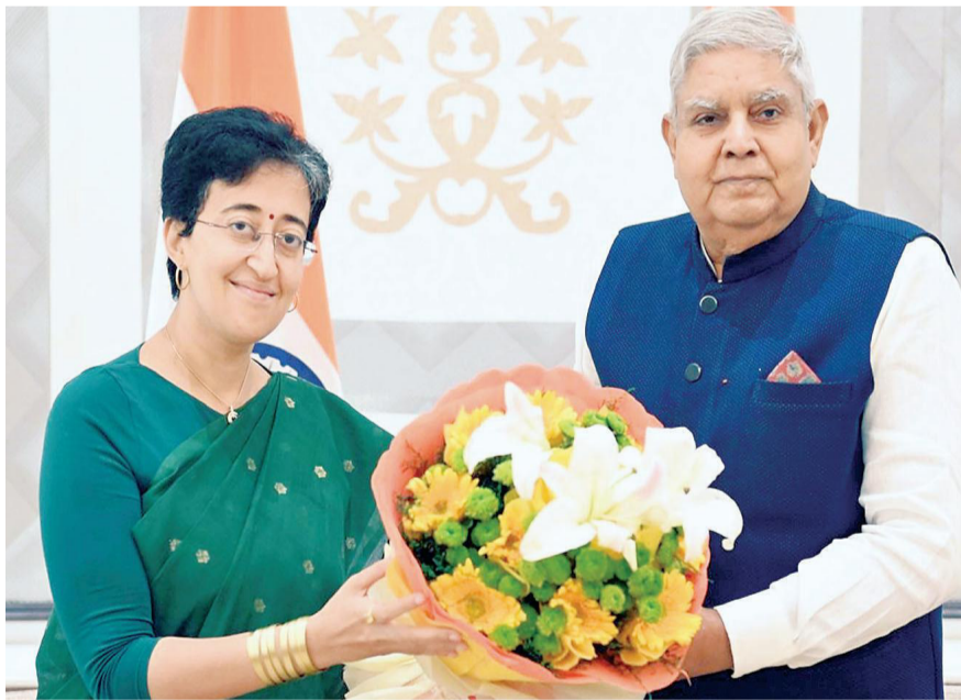
सोमवार को दिल्ली की मुख्यमंत्री आशिषी ने नई दिल्ली में उपराष्ट्रपति एन्वलेव में एक बैठक के दौरान उपराष्ट्रपति जगदीप धनखड़ से मुलाकात की।

ऊना: देश की प्रीमियम ट्रेन सेवाओं में से एक वंदे भारत ट्रेन पर हिमाचल प्रदेश के ऊना जिला में लगातार दो दिन पथराव करने की घटनाएं सामने आई हैं। जिला में शनिवार और रविवार लगातार दो दिन जिला में अलग-अलग जगह पर वंदे भारत ट्रेन पर पथराव की गई है। हालांकि इस पथराव के दौरान ट्रेन में सफर कर रहे यात्रियों को किसी प्रकार का कोई नुकसान नहीं पहुंचा लेकिन पथराव के चलते ट्रेन के कई शीशे क्षतिग्रस्त हुए हैं। इस पथराव के पीछे साजिश या शरारत का मामला अब एक बड़ा प्रश्न बन गया है। शनिवार को जिला मुख्यालय के निकट स्थित गांव बसाल में वंदे भारत ट्रेन की चार बोगियों पर पथराव मारे गए, जबकि रविवार को अब में ट्रेन की दो बोगियों को निशाना बनाया गया।